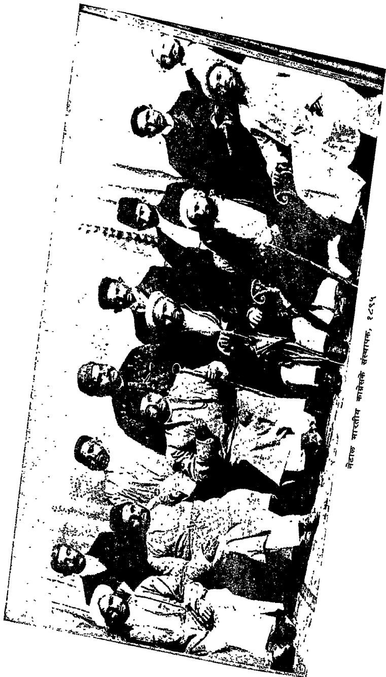
नेटाल भारतीय काँग्रेसके संस्थापक, १८९५